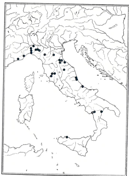
Fig. 1. — Rhyssemus parallelus Reitt.: parametro destro in visione laterale. Fig. 2. — Trichiorhyssemus dalmatinus Petr.: parametro destro in visione laterale. Fig. 3. — Rhyssemus parallelus Reitt.: geonemia accertata per l'Italia. Fig. 4. — Trichiorhyssemus dalmatinus Petr.: geonemia accertata per l'Italia.